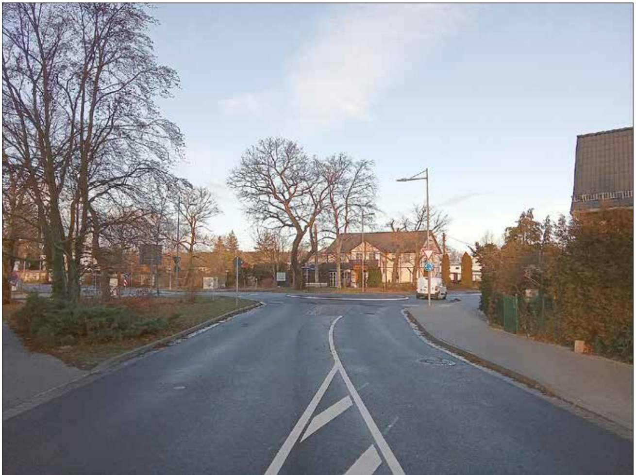
Der neue Kreisverkehr Lindenthaler Hauptstraße - An der Hufschmiede