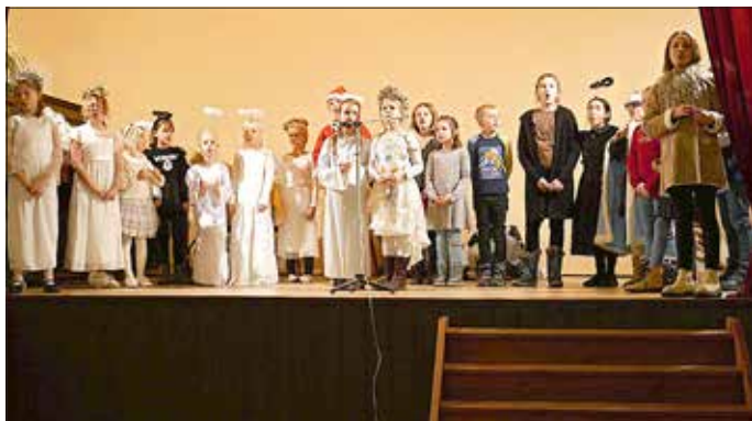
Die Theatergruppe der Grundschule Seehausen bot als Nächstes lehrreiche Sketche dar.